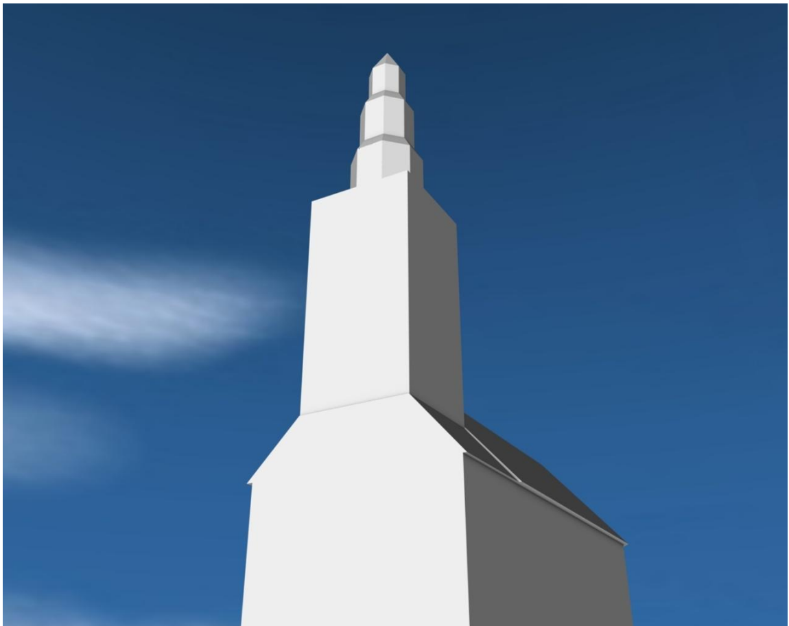
Turmhaube Rendering – Samimi