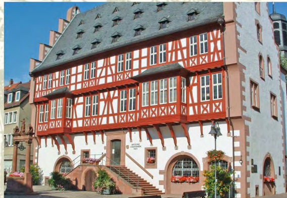
Das Deutsche Goldschmiedehaus am Altstädter Markt

Vernissage im Deutschen Goldschmiedehaus